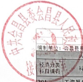
一般公共预算财政拨款基本支出决算表