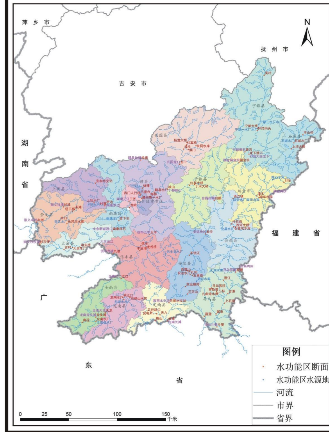
赣州市江河水体水功能区断面位置示意图